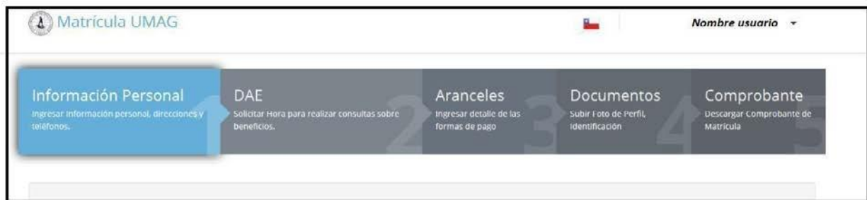
Figura N°3: Los pasos a seguir.

Información Personal, DAE, Aranceles, Documentos y Comprobante.