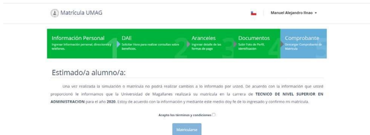
Figura N°8: Finalizar el proceso de matrícula.

En esta sección se puede visualizar el resumen de la matrícula, hay un informativo en la que el postulante debe aceptar que está de acuerdo con la información, debe dar fe de lo ingresado y confirmar la matrícula (ver imagen).