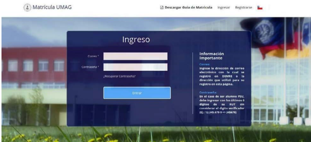
Figura N°2: Ingreso a la plataforma.

Para postulantes que ingresarán vía Prueba de Transición (PDT), debe ingresar el correo electrónico con el cual se registró en DEMRE y como contraseña debe ingresar con los últimos 6 dígitos de su RUT sin considerar el dígito verificador (Ej.: 12.345.678-9 => 345678), o el correo electrónico y clave con la cual se registró en esta página para alumnos no PDT.